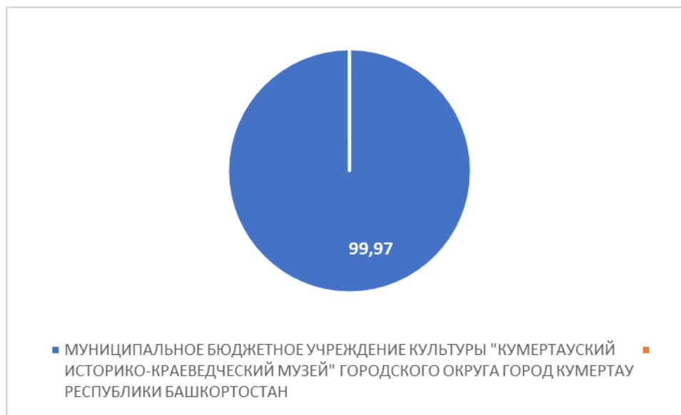
Рисунок 4 – Интегральный показатель по критерию «Доброжелательность, вежливость работников организации»

По четвертому критерию «Доброжелательность, вежливость работников организации» МУНИЦИПАЛЬНОЕ БЮДЖЕТНОЕ УЧРЕЖДЕНИЕ КУЛЬТУРЫ "КУМЕРТАУСКИЙ ИСТОРИКО-КРАЕВЕДЧЕСКИЙ МУЗЕЙ" ГОРОДСКОГО ОКРУГА ГОРОД КУМЕРТАУ РЕСПУБЛИКИ БАШКОРТОСТАН набрало 99,97 балла (Рис. 4).