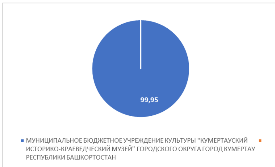
Рисунок 5 – Интегральный показатель по критерию «Удовлетворенность условиями оказания услуг»

По пятому критерию «Удовлетворенность условиями оказания услуг» МУНИЦИПАЛЬНОЕ БЮДЖЕТНОЕ УЧРЕЖДЕНИЕ КУЛЬТУРЫ "КУМЕРТАУСКИЙ ИСТОРИКО-КРАЕВЕДЧЕСКИЙ МУЗЕЙ" ГОРОДСКОГО ОКРУГА ГОРОД КУМЕРТАУ РЕСПУБЛИКИ БАШКОРТОСТАН набрало 99,95 балла (Рис.5).