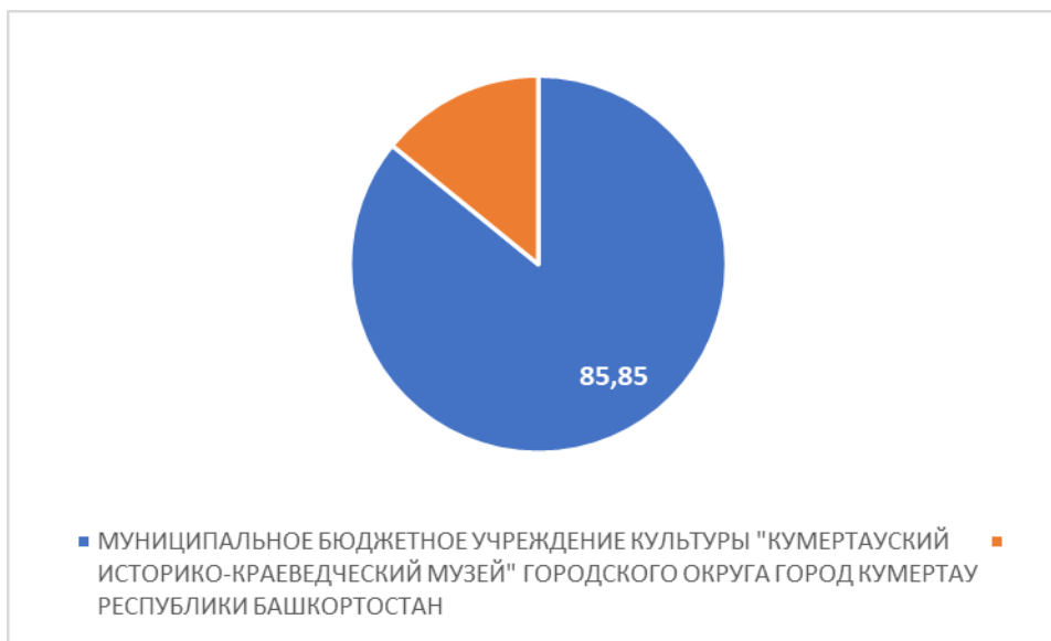
Рисунок 3 – Интегральный показатель по критерию «Доступность услуг для инвалидов»

По третьему критерию «Доступность услуг для инвалидов» МУНИЦИПАЛЬНОЕ БЮДЖЕТНОЕ УЧРЕЖДЕНИЕ КУЛЬТУРЫ "КУМЕРТАУСКИЙ ИСТОРИКО-КРАЕВЕДЧЕСКИЙ МУЗЕЙ" ГОРОДСКОГО ОКРУГА ГОРОД КУМЕРТАУ РЕСПУБЛИКИ БАШКОРТОСТАН набрало 85,85 балла (Рис.3).