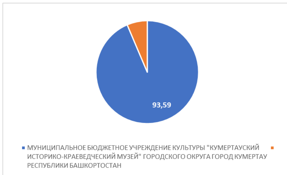
Рисунок 1 – Интегральный показатель по критерию «Открытость и доступность информации об организации культуры»

По первому критерию «Открытость и доступность информации об организации культуры» МУНИЦИПАЛЬНОЕ БЮДЖЕТНОЕ УЧРЕЖДЕНИЕ КУЛЬТУРЫ "КУМЕРТАУСКИЙ ИСТОРИКО-КРАЕВЕДЧЕСКИЙ МУЗЕЙ" ГОРОДСКОГО ОКРУГА ГОРОД КУМЕРТАУ РЕСПУБЛИКИ БАШКОРТОСТАН набрало 93,59 балла (Рис.1).